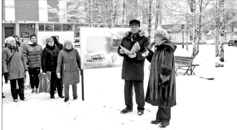
Открытие сквера Ветеранов

На прошлой неделе в администрации города состоялось заседание муниципальной комиссии по распределению межбюджетных трансфертов из областного бюджета бюджету Новодвинска в рамках реализации регионального проекта «Комфортное Поморье».