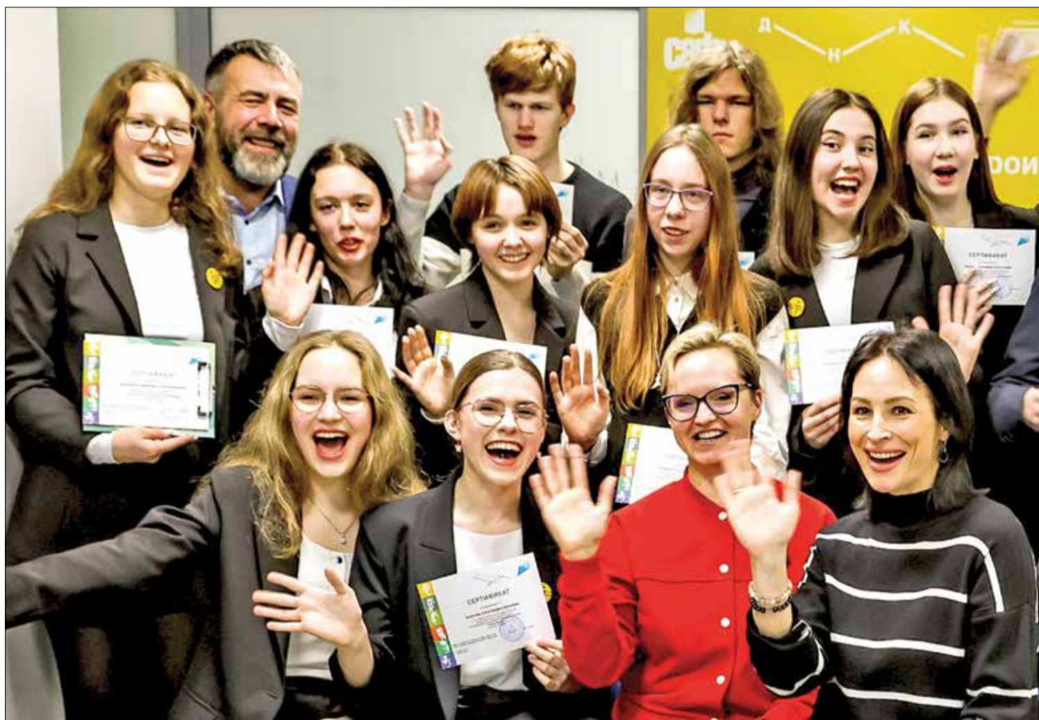
РАБОТНИКИ АЦБК стали экспертами в исследовательских проектах старшеклассников