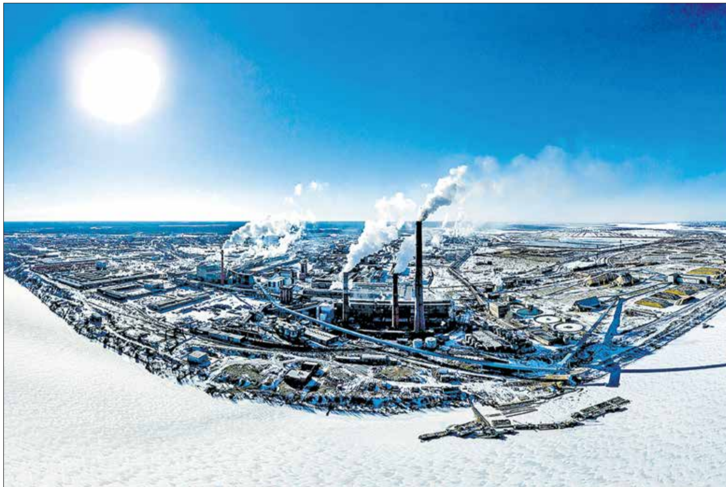
БЛИЗИТСЯ новая эпоха в энергетике Архангельского ЦБК