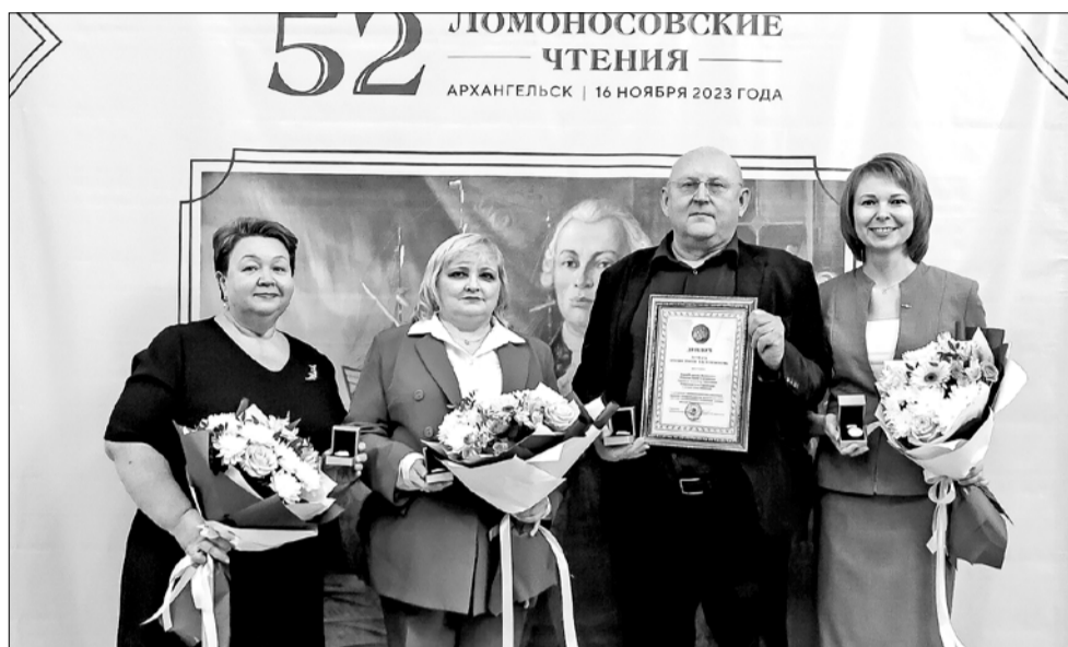
Группа организаторов проекта «Ламинобаланс»

Пленарному заседанию предшествовал митинг у памятника Михаилу Ломоносову, установленного возле центрального корпуса Северного (Арктического) федерального университета. Вечером участники Ломоносов-