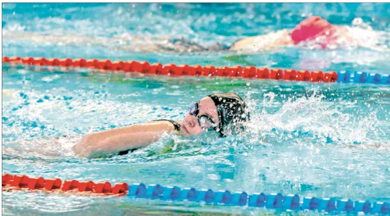
НА СОСТЯЗАНИЯХ в бассейне «Водолей»